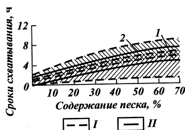
Рис. 6.1. Зависимость сроков схватывания шлакопесчаных растворов от содержания песка ( t = 150\text{ }^{\circ}\text{C} , p = 50\text{ МПа} ): I – области применения начала и конца схватывания; II – усредненные значения; 1, 2 – начало и конец схватывания

Для общей характеристики большого количества доменных гранулированных шлаков построен график (рис. 6.1), на котором показана зависимость сроков схватывания растворов от дозировки песка. Кривые, построенные на основании результатов приблизительно 700 анализов, дают качественную оценку шлакопесчаных смесей вообще как тампонажных растворов и позволяют судить о возможности применения их при температуре 150 °С и давлении 50 МПа. По данным опытов построены кривые (рис. 6.2), устанавливающие изменение пределов прочности на изгиб и сжатие шлакопесчаных образцов, выдержанных в течение 2 сут, при введении раз-